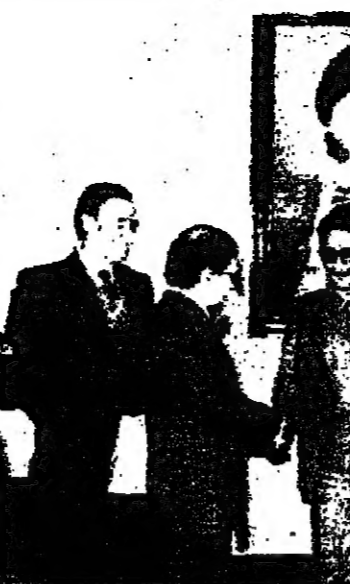
الرئيس الايراني يجتمع بأعضاء اللجنة الدولية المكلفة بالتحقيق في أعمال الشاه المخلوع

الناصرة - ارسا - اتسرت وزارة الداخلية ميزانية اضافية يبلغ ٣٠٢٥ مليون ليرة لميزانية العمومية للصحة للعام المالي الحالي جلوس جت الملك المحلي ، وذلك لتصبح الميزانية العمومية للسنة المالية ٨٠-٨١ لهذا المجلس ١٣٠٦٥ مليون ليرة.